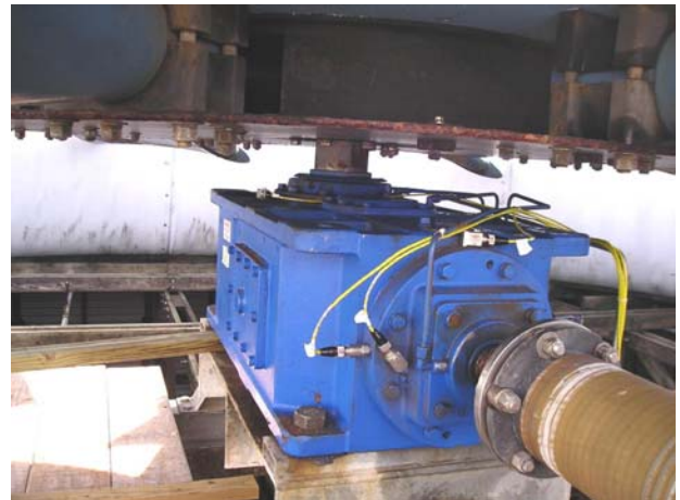
齿轮箱输入轴承机架上的 径向和轴向传感器

加速度振动传感器通常安装在电机和齿轮箱的重要位置上。由于齿轮箱是机械驱动链的负载轴承部分，加速度振动传感器应安装在输入和输出轴承机架上，以便测量其振动状态。