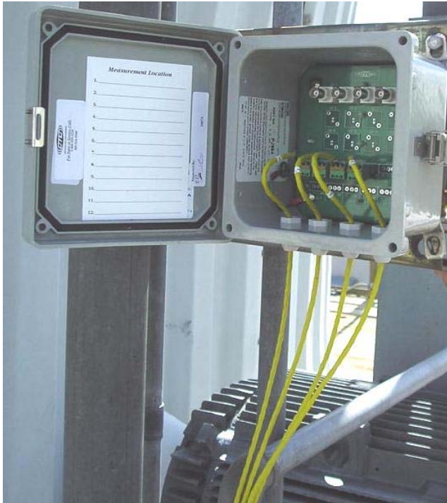
MX102-4C MAXX 接线箱带有 4 个频道 安装在冷却塔外面

对振动传感器来说安全可靠的连接是十分关键的.这也同样适用于数据采集器的电缆连接.有几种方式可以保证传感器电缆和数据采集器之间的连接干燥,干净,有序.便携式数据采集器的连接可以采用 MAXX 接线箱或者开关箱.这两种方式都可以为数据采集器提供方便的连接.永久安装型监视器的连接可以使用开关箱或信号管理箱,这两种方式都可以避免电缆交杂,更好的管理你的数据采集端口.