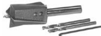
孔口平面, 钻孔后攻螺纹以便螺钉安装