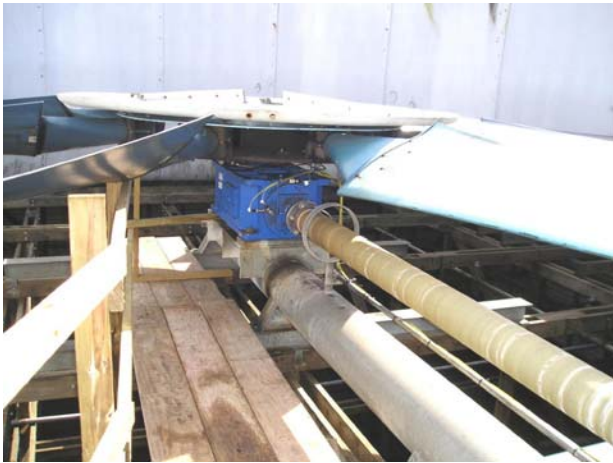
冷却塔转轴驱动型齿轮箱

冷却塔的振动传感器给振动分析师们带来了许多难点，特别是振动传感器的选择，安装和周围环境状况等等。电机一般都处于开放，便于接近的地方，但是几乎所有的故障都发生在齿轮箱。对振动分析师来说，不幸的是齿轮箱通常安装在危险的冷却塔碗下，也就刚好在旋转叶轮下面。有没有让电机很少出问题的奇迹出现呢？答案是安装永久型振动传感器可以保证其技术性和安全性。它也提高了冷却塔，包括振动分析师们的寿命和可靠性！